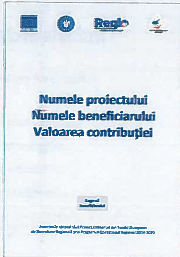
Afiș A2 vertical